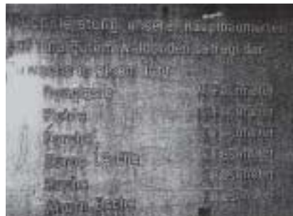
Abbildung 1 Wuchsleistung der Hauptbaumarten im Münsinger Forst

dann „ewig“ geerntet werden, wenn diese Abbauregel eingehalten wird - vorausgesetzt die Wachstumsbedingungen wie Güte des Humusbodens, der Luft etc. lassen ein ausreichendes Wachstum zu. Die Abbildung 1 zeigt, wie die einzelnen Baumarten im Münsinger Forst pro Jahr in Festmetern wachsen.