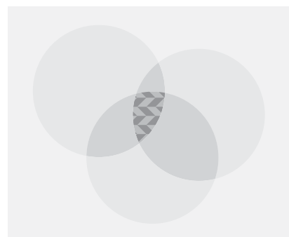
Abbildung 3 Die drei Säulen der Nachhaltigkeit

Damit sind wir bei der sog. „Drei-Säulen-Theorie“ der Nachhaltigkeit angelangt, die vor allem von der Enquete-Kommission des Deutschen Bundestags „Schutz des Menschen und der Umwelt“ vertreten wurde: Nachhaltige Entwicklung bedeutet, eine Balance zwischen Ökonomie, Ökologie und Sozialem herzustellen. Das bedeutet, bei allen Handlungen gleichzeitig die Ziele der Wirtschaftlichkeit, Umweltverträglichkeit und Sozialverträglichkeit zu verfolgen. Stellt man diese drei Bereiche als (durchsichtige) Säulen dar und schaut man diese von oben an, dann entstehen drei sich überlappende Ringe. Nachhaltigkeit ist im Überlappungsbereich verwirklicht (Abbildung 3).