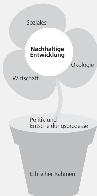
Abbildung 4 Die Nachhaltigkeitsblume (nach Thierstein/Walser)

sich diese Aspekte mit der Nachhaltigkeitsblume (Thierstein/Walser) zeigen (Abbildung 4).