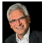
Oberbürgermeister Gunter Czisch Schirmherr lokale agenda ulm 21

Die Initiative startet Anfang 2019 in der Oststadt und wird Zug um Zug auf die anderen Ulmer Stadtteile ausgedehnt. Ich begrüße diese Initiative sehr und wünsche dem AK, dass sie auf große Resonanz stößt.